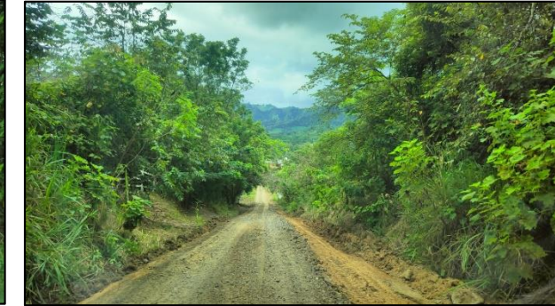
Mantenimiento de vías como la Palanca y las Lozas