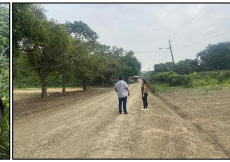
Mantenimiento de Vía Agua Fría