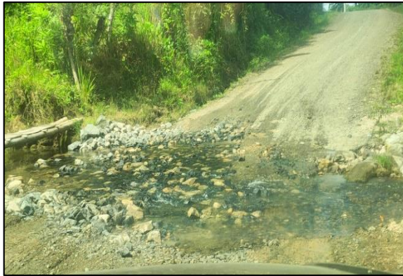
Colocación de Material en los Badenes en la vía el Bejuco